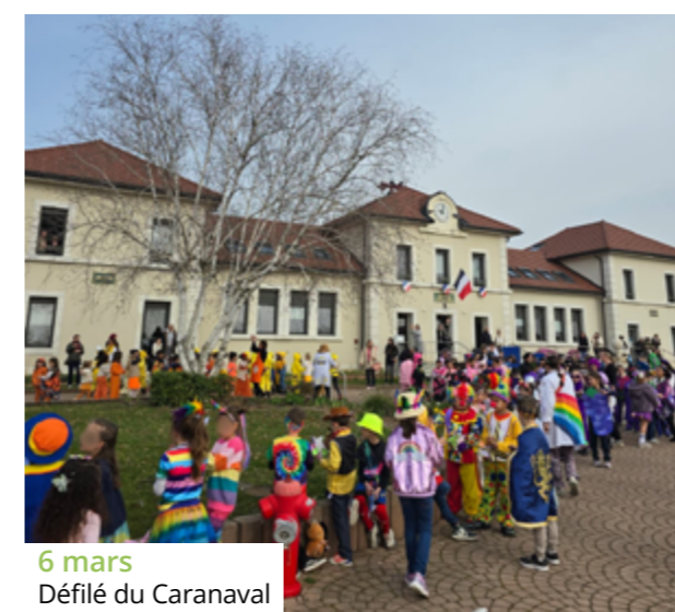
6 mars Défilé du Carnaval