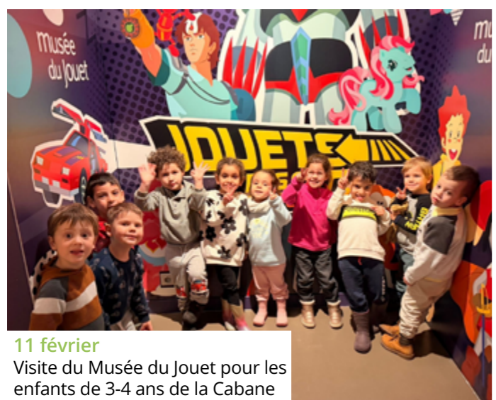
11 février Visite du Musée du Jouet pour les enfants de 3-4 ans de la Cabane