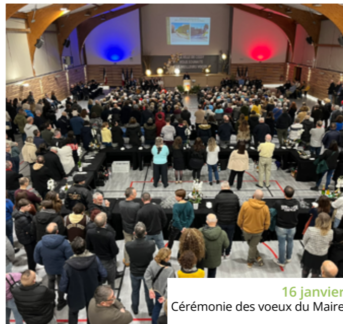
16 janvier Cérémonie des vœux du Maire