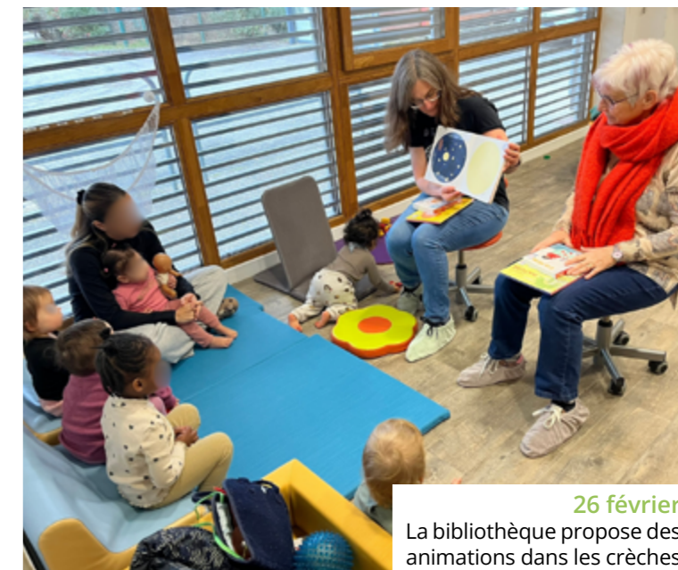
26 février La bibliothèque propose des animations dans les crèches