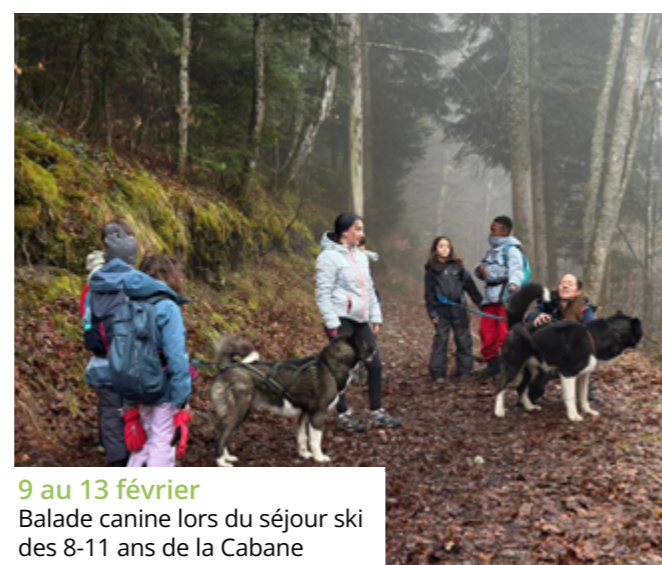
9 au 13 février Balade canine lors du séjour ski des 8-11 ans de la Cabane