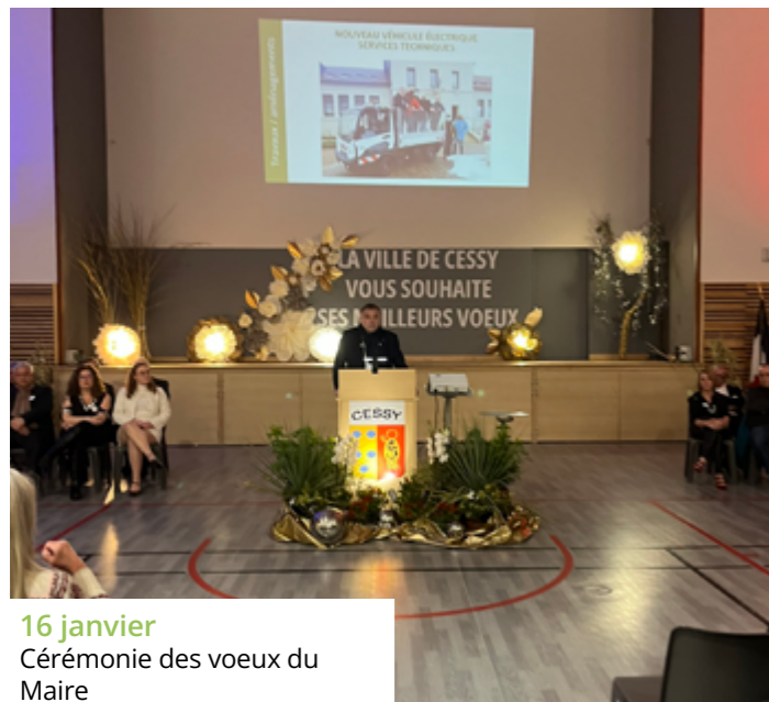
16 janvier Cérémonie des vœux du Maire