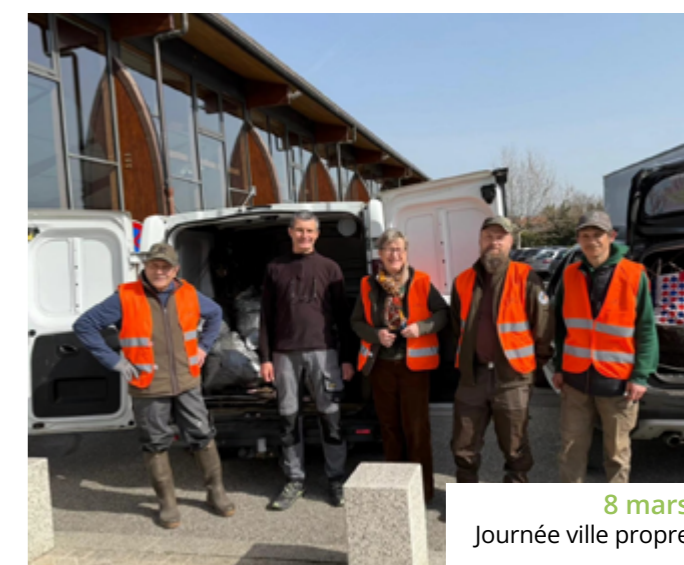
8 mars Journée ville propre