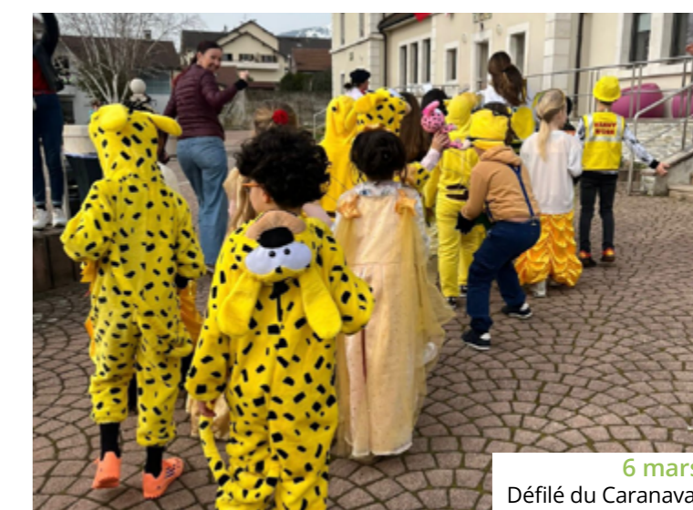
6 mars Défilé du Carnaval