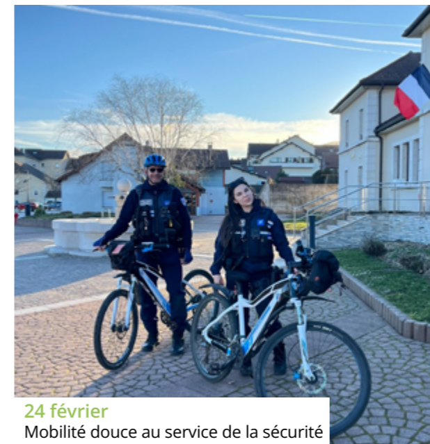
24 février Mobilité douce au service de la sécurité