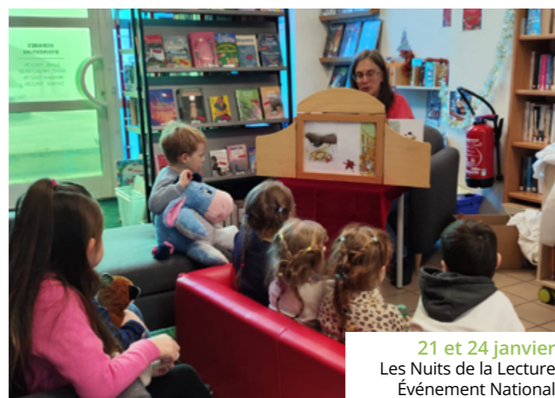
21 et 24 janvier Les Nuits de la Lecture Événement National