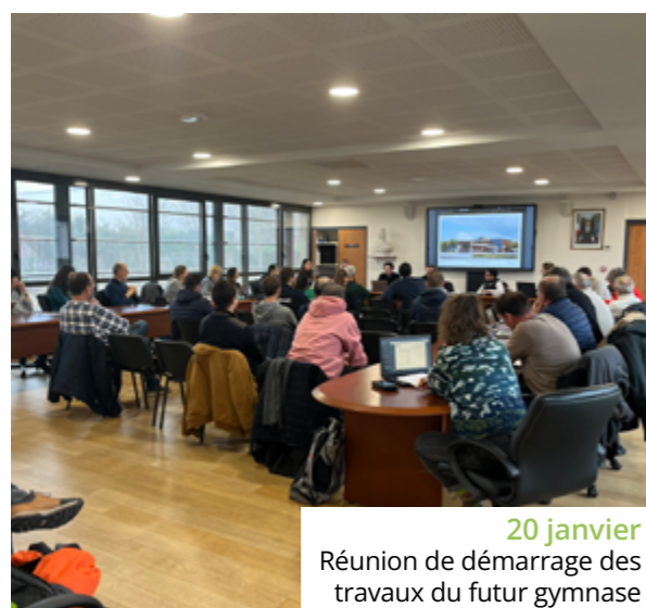
20 janvier Réunion de démarrage des travaux du futur gymnase