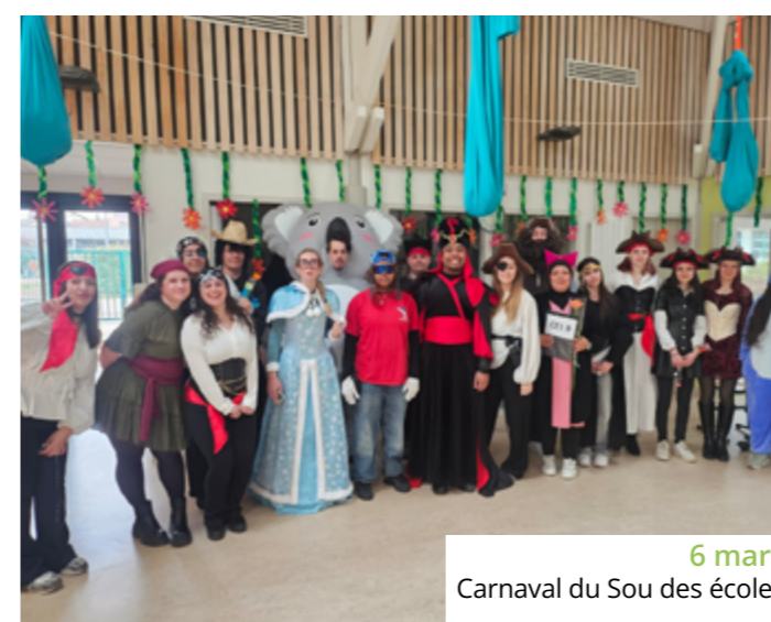
6 mars Carnaval du Sou des écoles